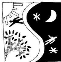
LA ROUTE DES SEL